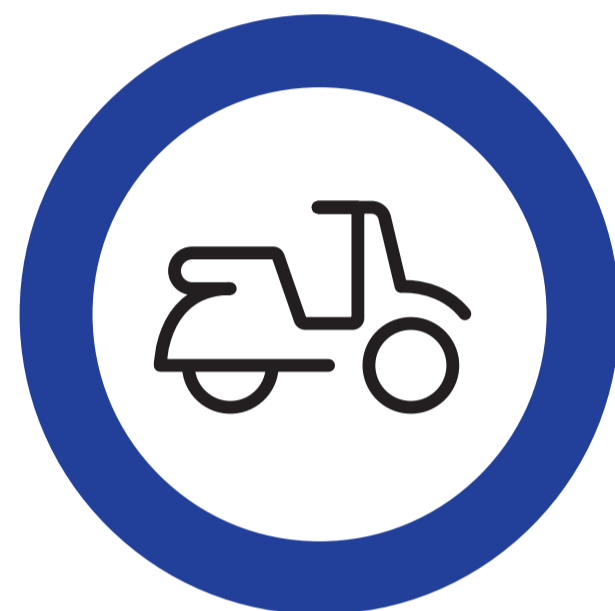
Motos / Scooters