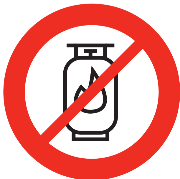
Bouteille de gaz